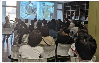
みんなで講習を受けました。